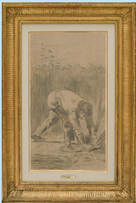
フィンセント・ファン・ゴッホ《鎌で刈る人(ミレーによる)》 1880年頃、上原近代美術館

上原近代美術館は、世界的なゴッホ研究者として知られるシュラール・ファン・ヒューフテン氏をお招きして講演会を開催します。ゴッホは画業のはじまりになぜミレーを模写したのか、晩年に再び模写した意味とは何だったのか、ゴッホ芸術の秘密とその魅力についてお話いただきます。